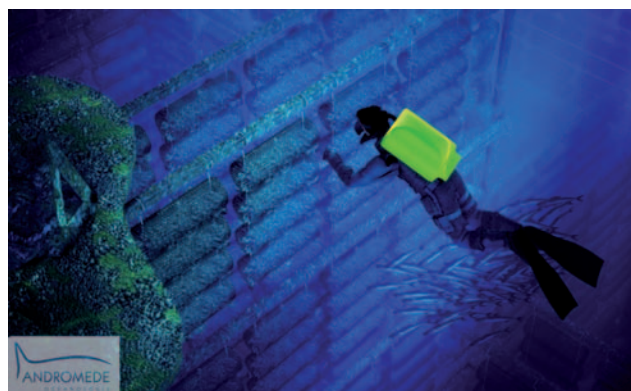
Projet de récif artificiel de production conchylicole

Mise en place et animation du réseau de surveillance RECOR (Réseau Coralligène) du coralligène comme bio-indicateur de la qualité des eaux côtières dans le cadre de la Directive Européenne Cadre Eau. Elaboration du logiciel CPCe Coraligeneous assemblages avec l'université de Floride. Agence de l'eau RMC. 140K€/an.