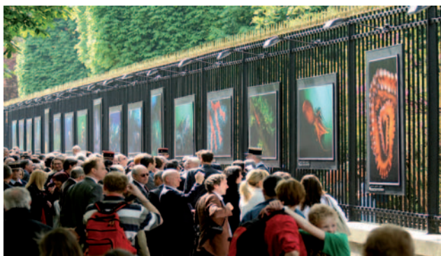
Exposition de L. Ballesta au Sénat

Etude des possibilités et recherche d'une méthode innovante de transplantation de Pinna nobilis. Groupe EIFFAGE.