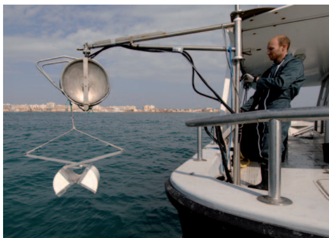
Etude du benthos

Etude de faisabilité pour la création d'un outil d'assistance informatique pour un mouillage respectueux de l'environnement marin. 25K€ (développement interne).