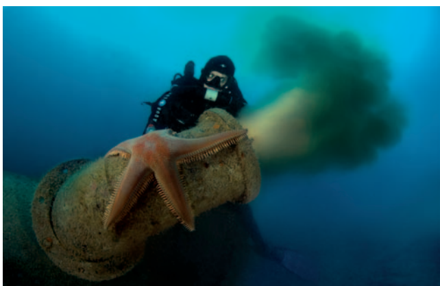
Suivi de l'émissaire de Cannes

Mise à jour du « guide des rejets urbains et des systèmes d'assainissement en Mer Méditerranée » en collaboration avec IFREMER. Contrat Agence de l'Eau. 20K€.