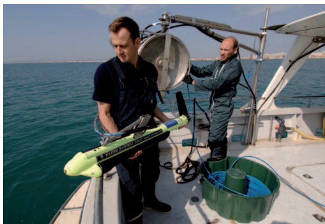
Cartographie par sonar latéral

Etude des récifs artificiels de Golfe Juan et de Beaulieu, Conseil Général des Alpes Maritimes.