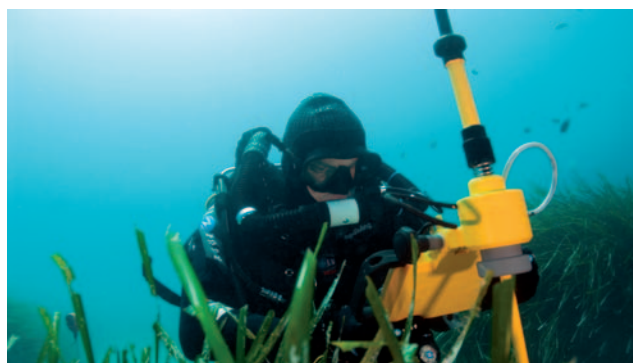
Microcartographie des herbiers par télémétrie acoustique

Etude du Corail rouge (Corallium rubrum) dans la réserve marine de Banyuls sur mer. Répartition, abondance, morphométrie, exploitation. Conseil Général des Pyrénées Orientales.